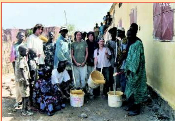
Chantier de solidarité organisé par l'Association Achéroise de Solidarité Internationale en 2003. Pendant 15 jours, une dizaine de jeunes ont procédé à la construction d'une école dans un village du Mali.