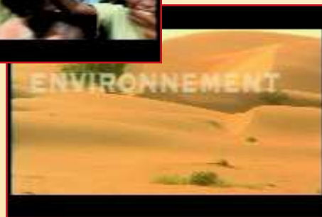
La santé, l'éducation, la culture ou l'environnement sont les différents thèmes abordés par l'émission bimensuelle Initiative Africa.

d'Initiative Africa : "c'est un magazine qui respecte les individualités et les collectivités, locales, nationales et régionales. Les reportages dressent le portrait de ces hommes et de ces femmes qui, dans les villes ou les campagnes d'Afrique, travaillent à changer la vie des gens au quotidien. Par le caractère exemplaire des histoires racontées et par la présence d'un invité vedette impliqué dans le développement, le magazine a comme objectif de promouvoir et stimuler l'esprit d'initiative".